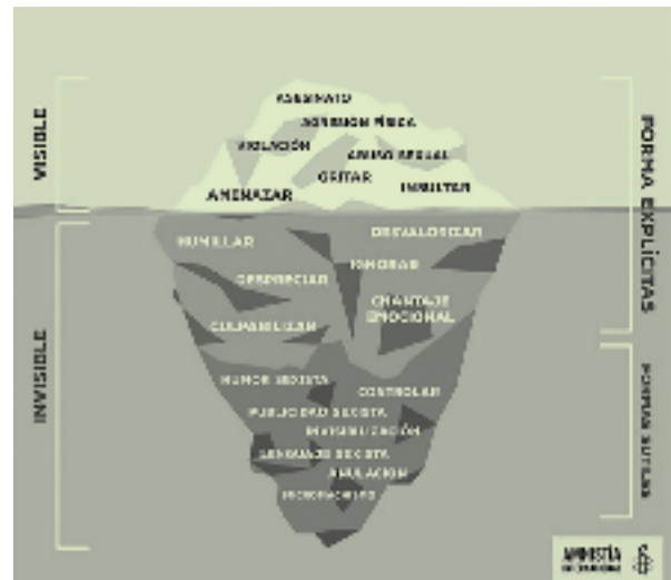
Iceberg del maltrato/ Amnistía Internacional

https://heterodoxia.wordpress.com/2007/11/09/deja-aqui-tu-frase-y-rompe-el-silencio-contra-la-violencia-machista/